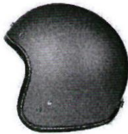
ด้านซ้าย