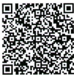
เอกสารประชาสัมพันธ์

การส่งผลงาน : เสนอผลงานผ่านระบบข้อมูลสารสนเทศวิจัยและนวัตกรรมแห่งชาติ (NRIIS) เว็บไซต์ https://nriis.go.th ตั้งแต่บัดนี้เป็นต้นไปจนถึงวันที่ ๒๕ มกราคม ๒๕๖๘ ตลอด ๒๔ ชั่วโมง ไม่เว้นวันหยุดราชการ สำหรับวันปิดรับสมัคร (๒๕ มกราคม ๒๕๖๘) จะปิดรับภายในเวลา ๑๖.๓๐ น.