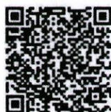
QR code สำหรับลงทะเบียน

นักวิจัย นักวิชาการ และผู้สนใจทั่วไป สามารถลงทะเบียนตาม QR code ภายในวันพุธที่ ๒๕ กันยายน ๒๕๖๗