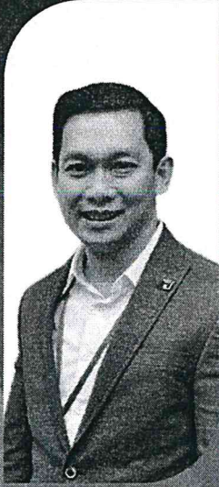
ศ.ดร.อรรณพ ควลงเสียง