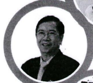
ศ.ดร.นรินทร์ สังข์รักษา