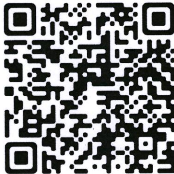
QR Code ดาวน์โหลดแบบฟอร์มและ TOR

หมายเหตุ สามารถดาวน์โหลดแบบฟอร์มได้ที่ http://research.swu.ac.th และเลือก Research Grant (อยู่หน้าแรกของเว็บไซต์) หรือ โหลดจาก QR code