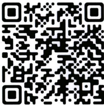
QR Code ดาวน์โหลด TOR และแบบฟอร์ม

เครือข่ายวิจัยเครือข่ายอุดมศึกษาภาคกลางตอนบน