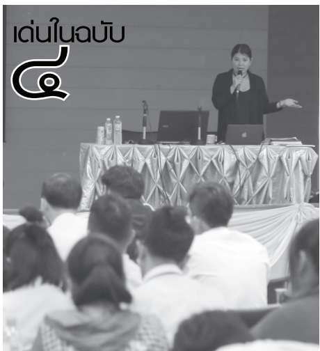
เด่นในฉบับ