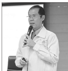
ณ ห้องประชุมจันทร์จรัส ชั้น ๓ อาคารสำนักงานอธิการบดี เมื่อวันที่ ๑๓ กันยายนที่ผ่านมา