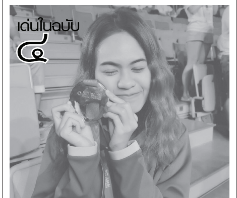
เด่นในฉบับ

“การสัมมนาครั้งนี้ เรามุ่งเป้าหมายไปที่กลุ่มนักศึกษา คณะคณาจารย์ของมหาวิทยาลัยราชภัฏทั้งหมด และนักธุรกิจ อยากให้มาร่วมรับฟังและร่วมเสนอแนวทางที่จะนำหลักคุณธรรมไปช่วยในการแก้ไขปัญหา รวมทั้งร่วมกันเผยแพร่การนำคุณธรรมไปใช้ควบคู่กับความรู้ได้อย่างมีประสิทธิภาพมากยิ่งขึ้น” ประธานกรรมการฯ กล่าว