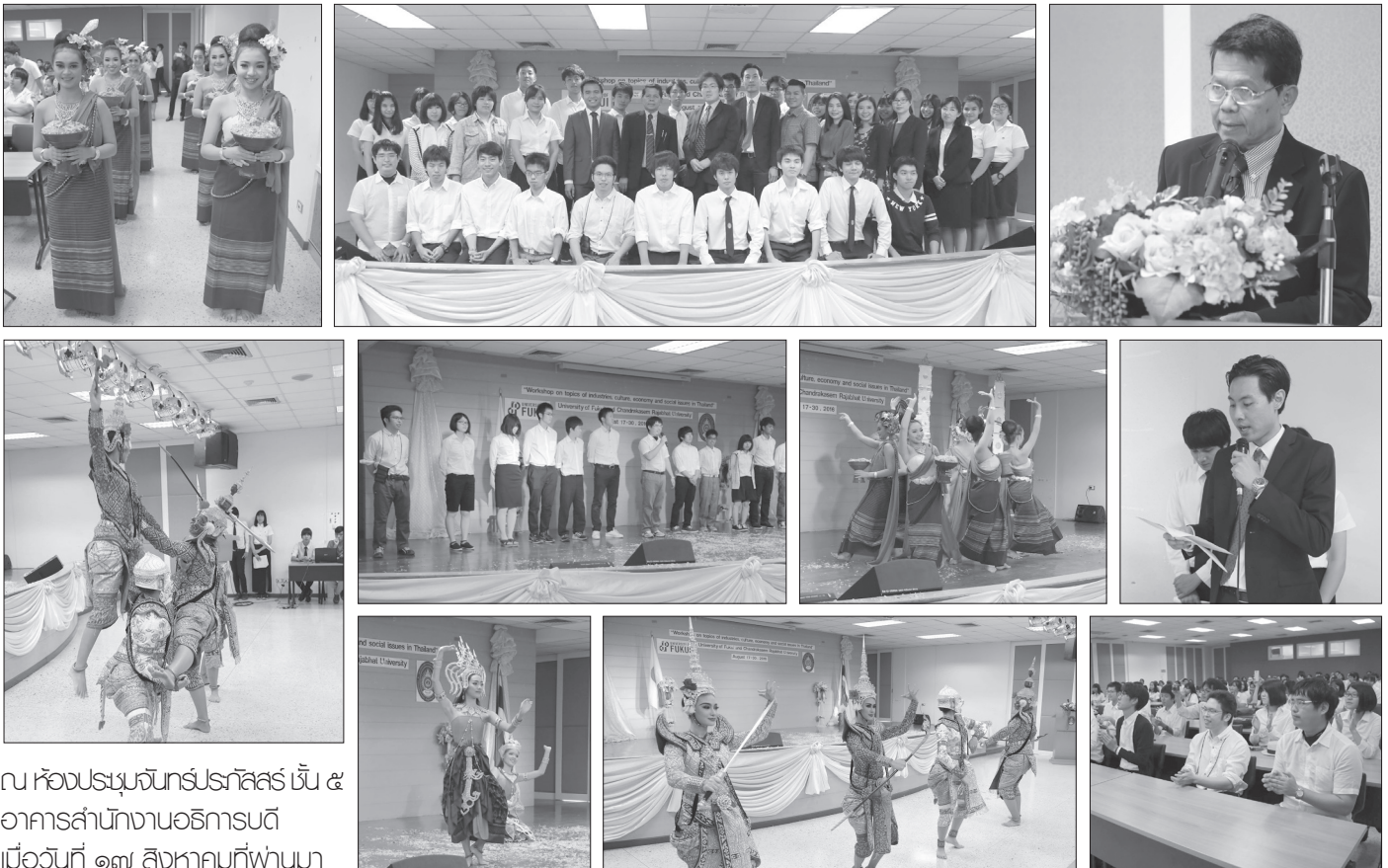
ณ ห้องประชุมจันทร์กระจ่างฟ้า ชั้น ๕ อาคารสำนักงานอธิการบดี เมื่อวันที่ ๑๓ สิงหาคมที่ผ่านมา

โดย คณะมนุษยศาสตร์และสังคมศาสตร์ ร่วมกับ Fukui University