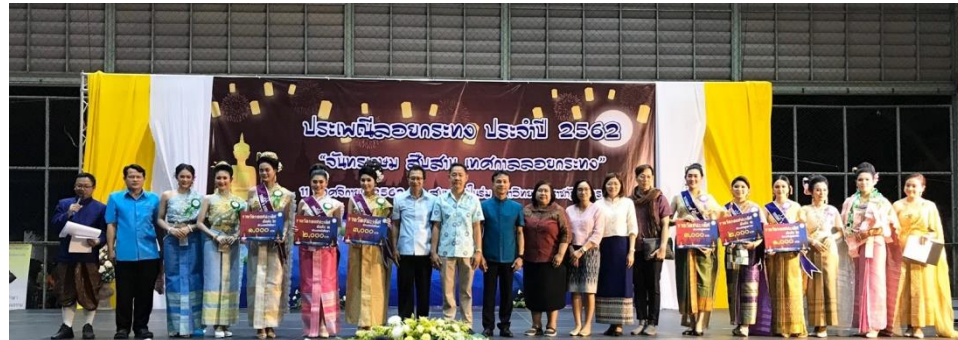
ประเพณีลอยกระทง ประจำปี 2562 “จันทรเกษม สืบสาน เทตมาลลอยกระทง”