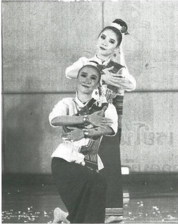
พื่อนสาวปือดออยชอย

หัวข้อข่าว: นาฏศิลป์ไทยชุดใหม่ล่าสุด ผลงานวิจัยของนักศึกษา มจร.