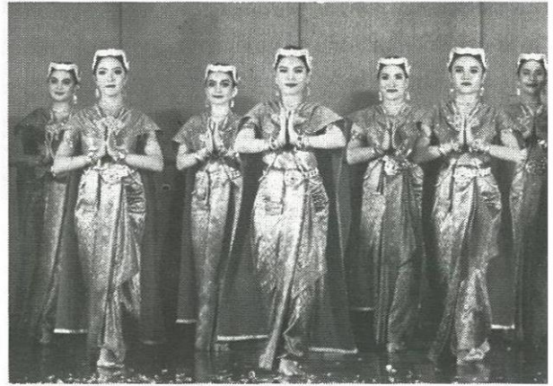
รำพนารีศรีนพเคราะห์

นักศึกษาชั้นปีที่ 4 สาขาวิชานาฏศิลป์ และศิลปะการแสดง คณะมนุษยศาสตร์ และสังคมศาสตร์ มหาวิทยาลัยราชภัฏ จันทระเกษม (มจร.) ได้ศึกษาค้นคว้าทำงานวิจัยทางนาฏศิลป์ เพื่อประมวลผลการเรียนรู้ทุกรายวิชาที่ได้ศึกษามา พร้อมนำประสบการณ์ในห้องเรียนและความรู้จากข้างนอกมาคิดสร้างสรรค์เป็นการแสดงนาฏศิลป์ชุดใหม่ โดยหวังจะต่อยอดศิลปะนาฏศิลป์ และนำเสนอผลงานวิจัยที่นำความเชื่อ ประเพณี ท้องถิ่น มารังสรรค์ ให้เป็นการแสดงนาฏศิลป์ชุดใหม่ 4 ชุด เพื่อการอนุรักษ์เชิงบูรณาการสานต่อวัฒนธรรม