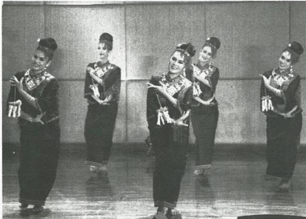
ฟ้อนมาลาบูชาพุทธ