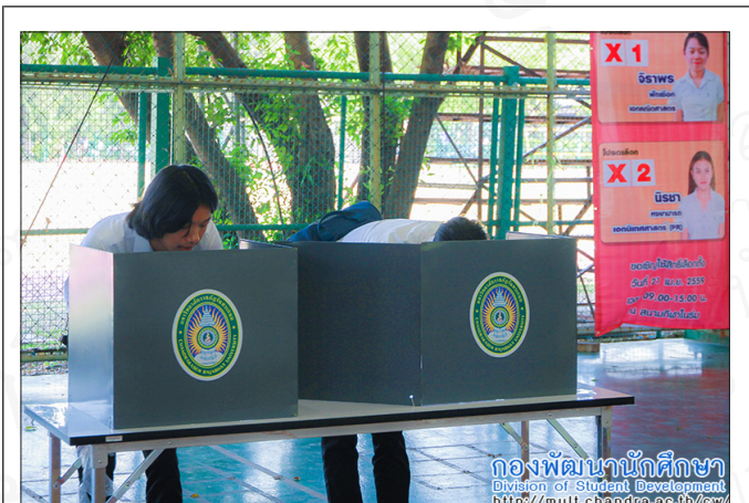
กองพัฒนานักศึกษา Division of Student Development http://multichandra.ac.th/view

นักศึกษาสาขา และคณะต่าง ๆ เข้าดูหา ใช้สิทธิเลือกตั้ง นายกองค่านักศึกษา ประจำปีการศึกษา 2559 เพื่อเลือก ตัวแทนนักศึกษามาเป็นกระบอกเสียงและดำเนินงานด้าน กิจกรรมของมหาวิทยาลัย ซึ่งจัดโดยกองพัฒนานักศึกษา ณ สนามกีฬาในร่ม เมื่อเร็ว ๆ นี้