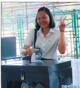
กองพัฒนานักศึกษา