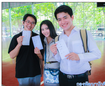
กองพัฒนานักศึกษา