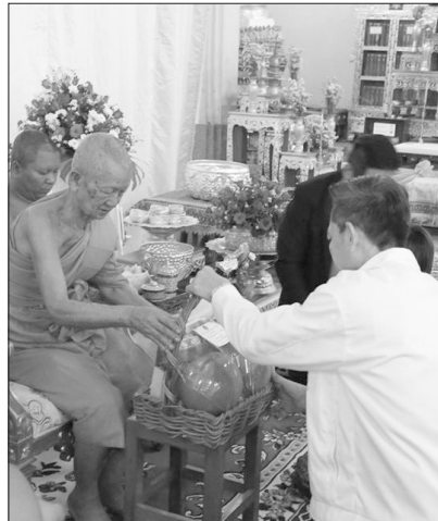
ณ ศาลาการเปรียญวัดสระไม้แดง อ.สรรคบุรี จ.ชัยนาท เมื่อเร็ว ๆ นี้