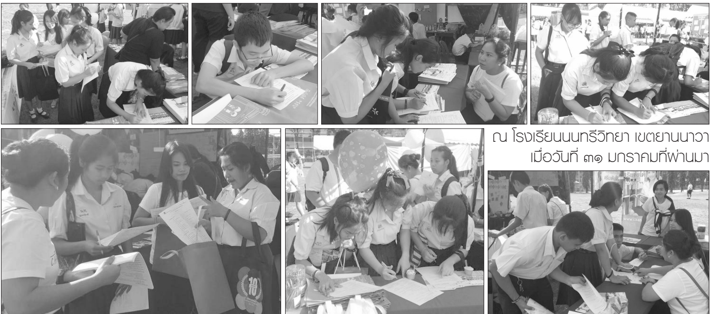
ณ โรงเรียนนนทรีวิทยา เขตยานนาวา เมื่อวันที่ ๓๑ มกราคมที่ผ่านมา