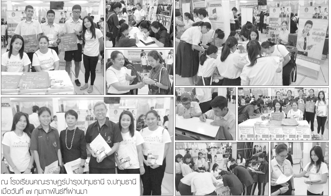
ณ โรงเรียนคนละราษฎรบำรุงปทุมธานี จ.ปทุมธานี เมื่อวันที่ ๓ กุมภาพันธ์ที่ผ่านมา