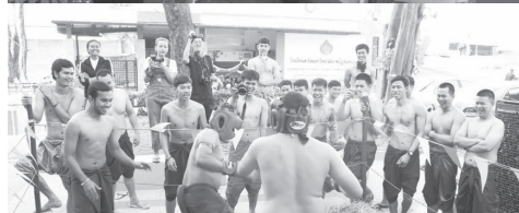
“วิทยาศาสตร์” กับ “วัฒนธรรมไทย” ผสมผสานจาก ...“พ่อหลวง”